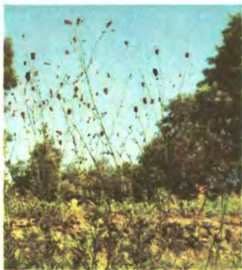
942. Родовик лікарський.